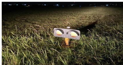
Gambar 1. Runway Guard Light (RGL)

Dikutip dari Simanjuntak (2022) Runway Guard Light digunakan untuk memperingatkan para pilot bahwa mereka akan memasuki runway ketika mereka berada di taxiway. Lampu tersebut harus dipasang pada semua taxiway secara bersamaan jika memungkinkan. Runway Guard Light berada pada jarak yang sama dengan garis tengah taxiway, atau centerline taxiway. Itu tidak lebih dari 3 meter dan tidak lebih dari 5 meter di luar tepi taxiway. Sali (2021) Runway Guard Light harus ditempatkan di seberang taxiway keseluruhan, termasuk fillet, holding bays dan lain-lain, pada runway holding position terdekat dengan runway, dengan lampu di tempatkan pada interval jarak 3m. Runway Guard Light memancarkan warna kuning dengan masing-masing pasangan dinyalakan secara bergantian dengan 30 hingga 60 siklus per menit dan waktu diam dan menyala haruslah sama dan dilakukan bergantian untuk setiap lampu. Runway Guard Light di Bandar Udara Internasional I Gusti Ngurah Rai Bali merupakan merk ADB dengan daya 100 watt.