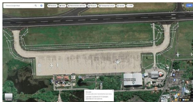
Gambar 2. Jalur Rancangan Kabel Primer Taxiway

Untuk mendapatkan circuit baru pada 86 lampu taxiway, jalur kabel primer harus diperpanjang dari sisi selatan (lokasi CCR) menuju taxi selatan dan kembali menggunakan jalur yang sama. Panjang jalur kabel taxiway adalah 4,11 km, seperti yang digambarkan pada gambar di bawah ini.